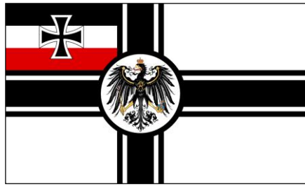
Рис. 3. Військово-морський прапор Німеччини, використовувався у період 1903–1919 рр.