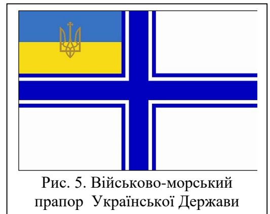
Рис. 5. Військово-морський прапор Української Держави

Використовуючи німецькі й британські вексіологічні традиції геральдична комісія до літа 1918 р. напрацьовувала різні проекти військово-морського прапора. Основою залишився хрест Святого Архангела (Архистратига) Михаїла синього кольору, розміщеного на білому тлі. Хрест був рівним за товщиною \frac{1}{11} частини довжини полотнища, його облямовували вузькі біла і синя смужки (товщина обох дорівнювала \frac{1}{8} товщини хреста), у крижі розмістили національний (державний) український прапор синьо-жовтих барв, поверх якого золотий тризуб з хрестом над середнім зубом. Авторство Військово-морського прапора Українського Державного Флоту належить відомому українському художнику Ю. Нарбуту (рис. 5 [6]).