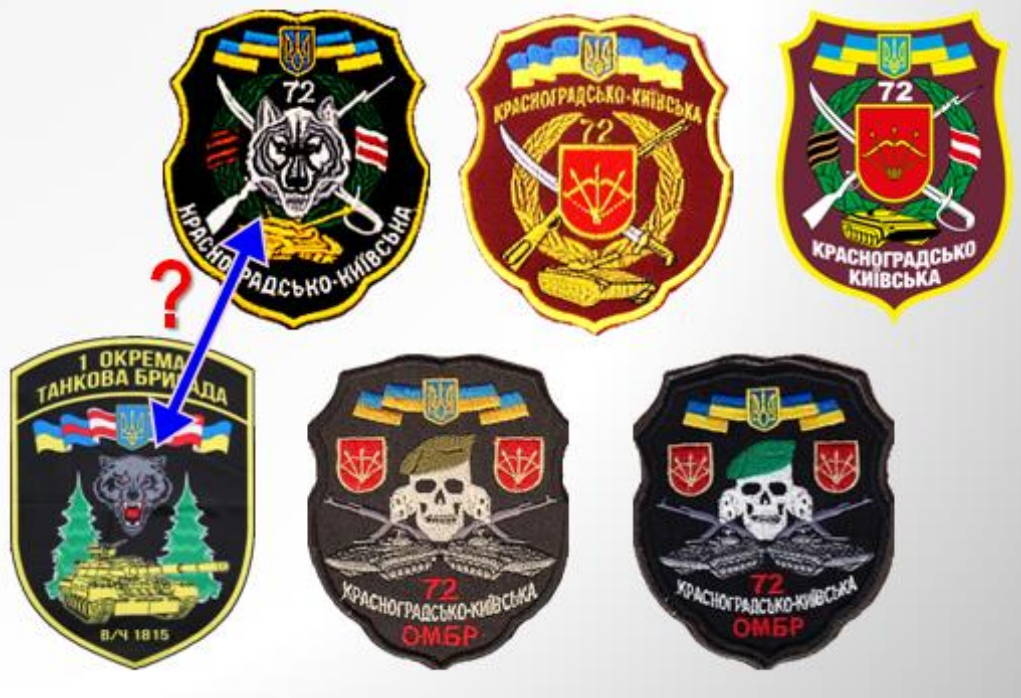
Фото 3. Чудасії у Сухопутних військах