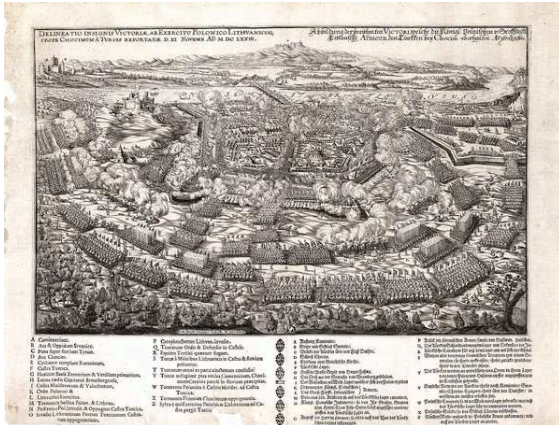
Хотинська битва, 1673