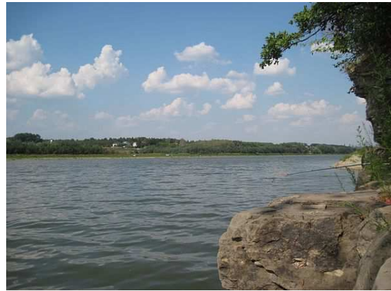
Національний природний парк "Хотинський" поблизу Хотина

Місто межує з національним природним парком «Хотинський» [1] (офіс - вул. Олімпійська 69) та національним природним парком «Подільські Товтри». При північно-східній околиці міста Хотин, поруч з Хотинською фортецею, знаходиться ландшафтний заказник місцевого значення Хотинська фортеця.