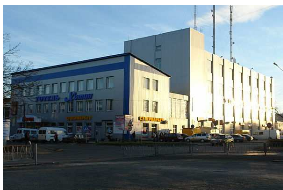
Торговельний центр у центрі міста