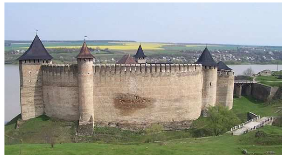
Хотинська фортеця — форпост захисту південних кордонів від турецької загрози