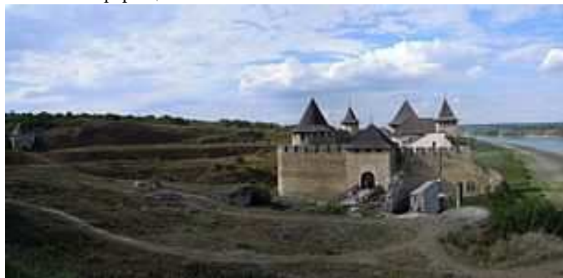
фортеці та Дністра