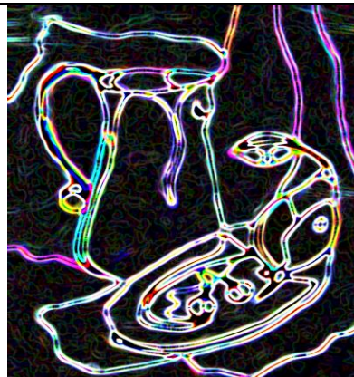
Комп. графіка (фільтри)