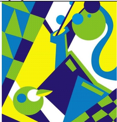
Комп. графіка (вектор)